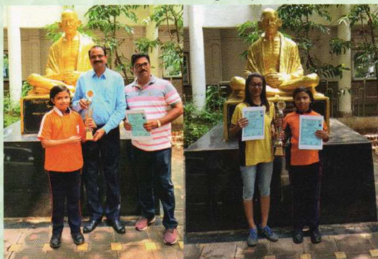
State Level Skating Championship