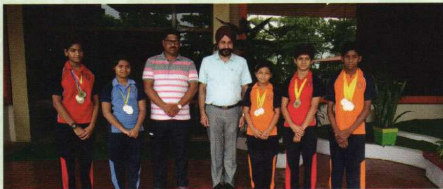
National Level Swimming Championship