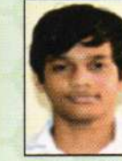
90.00% PREM ABHINAV