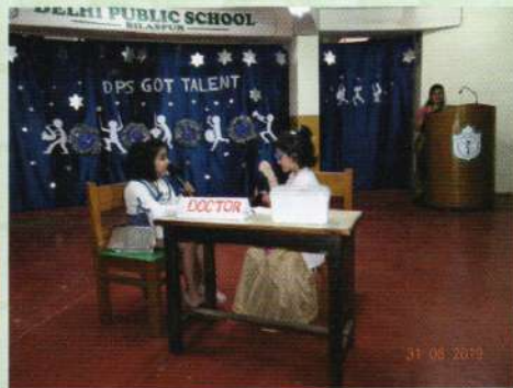
DPS Got Talent