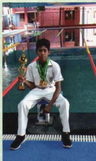
All India Inter DPS Swimming Championship Boy's