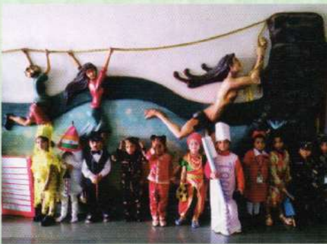
Fancy Dress Activity