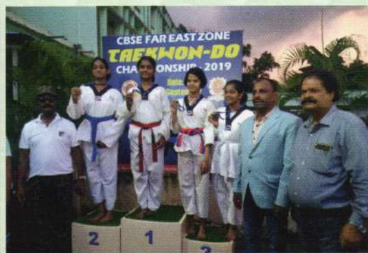
CBSE far East Zone Taekwondo Championship