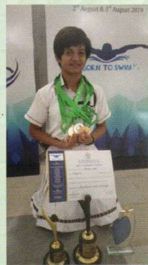
All India Inter DPS Swimming Championship Girl's