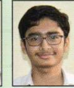
95.70% HARSH WARDHAN